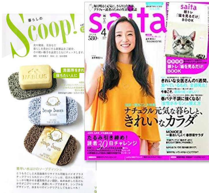
2018年4月号 “暮らしを豊かにする新製品をご紹介！”