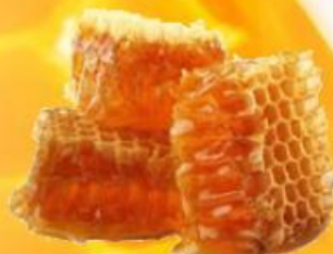
HOT HONEY FACE MASK